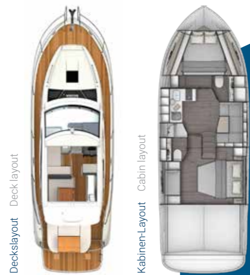
Deckslayout Deck layout