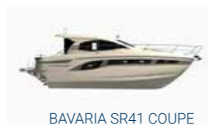
BAVARIA SR41 COUPE