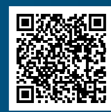
Kabinen-Layout Cabin layout

Konfigurieren Sie sich Ihre ganz persönliche BAVARIA Yacht. Configure your own personal BAVARIA yacht.